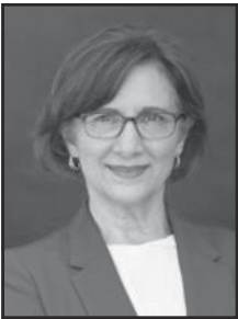
Suzanne Bonamici bonamiciforcongress.com

La crisis climática es una amenaza a la existencia y una emergencia nacional y yo seguiré trabajando en el Congreso para tener acciones significativas para disminuir las emisiones, para una transición a la energía limpia, para desarrollar la energía y defender nuestro planeta para las próximas generaciones. Como miembro del Comité Selecto sobre la Crisis Climática, he ayudado a redactar y estoy trabajando para implementar nuestro Plan de Acción Climática. El Plan tiene más de 500 páginas de recomendaciones detalladas de políticas basadas en la ciencia que abarcan todos los sectores de la economía.