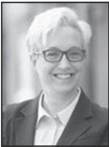
Tina Kotek tinafororegon.com

Oregón está encarando grandes desafíos. Yo seré una fuerza por un cambio positivo y produciré resultados. Como Gobernadora: me encargaré de la crisis de indigencia aumentando equipos de atención en las calles; ampliando los refugios gestionados, mejorando el acceso a los servicios de salud y construyendo más viviendas; cumpliré nuestra promesa de ampliar el acceso a los servicios de tratamiento para la drogadicción y recuperación en todo el estado y lucharé por el cambio climático y por crear empleos con buenos empleos en energías limpias.