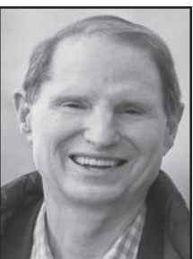
Ron Wyden

Como Presidente del Comité de Finanzas del Senado, he encabezado la lucha por suprimir los subsidios a los combustibles que han acelerado la crisis climática. He sido autor de partes importantes de la Ley de Reducción de la Inflación recién firmada, que es la mayor inversión en la lucha contra la emergencia climática. Esta ley referente reducirá los costos de la energía, conseguirá nuestra independencia energética y recortará drásticamente las emisiones de carbono hasta en un 40%.